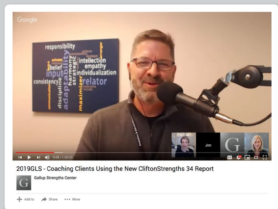
Gallup učebná séria pre Gallup koučov silných stránok

Tieto exkluzívne vzdelávacie príležitosti vás udržia na špičke vedy o silných stránkach a ich využívaní.